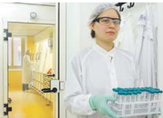
Rechts: An eine chirurgische Station erinnert die Arbeitsatmosphäre in der Schleuse zum Reinstlabor

für Luft- und Raumfahrt einbauen.“ Das Gerät – es trägt den Namen ‚Finch‘ für Fast Ice Nucleus Chamber – soll Eiskeime in der Troposphäre messen. „Nur jede zehnte Wolke regnet ab, neun Wolken verdunsten wieder, ohne dass Regen fällt“, so Curtius. Denn Regen entsteht nur, wenn sich Eiskristalle bilden, wachsen, schwerer werden und schließlich herabfallen. „Wassertropfen werden nicht so groß. Man braucht Eis“, so Curtius.