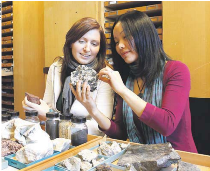
Früh übt sich: Die korrekte Bestimmung von Mineralen und Gesteinen lernen angehende Geologinnen und Geologen ab dem ersten Semester (links). Grundlage für derartige Übungen ist die umfangreiche Lehrsammlung des Fachbereichs Geowissenschaften/Geographie (Ausschnitt unten)